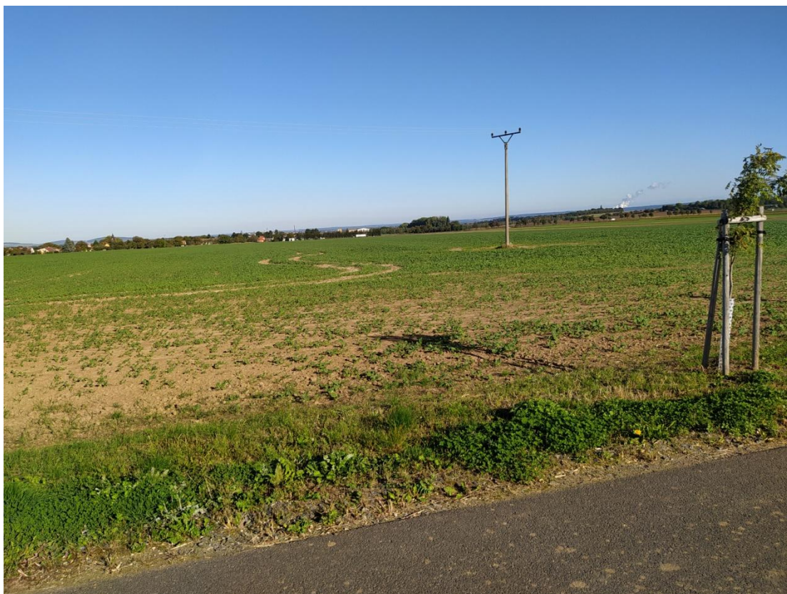
Pohled na konec úseku a napojení na HPC15 – proti staničení