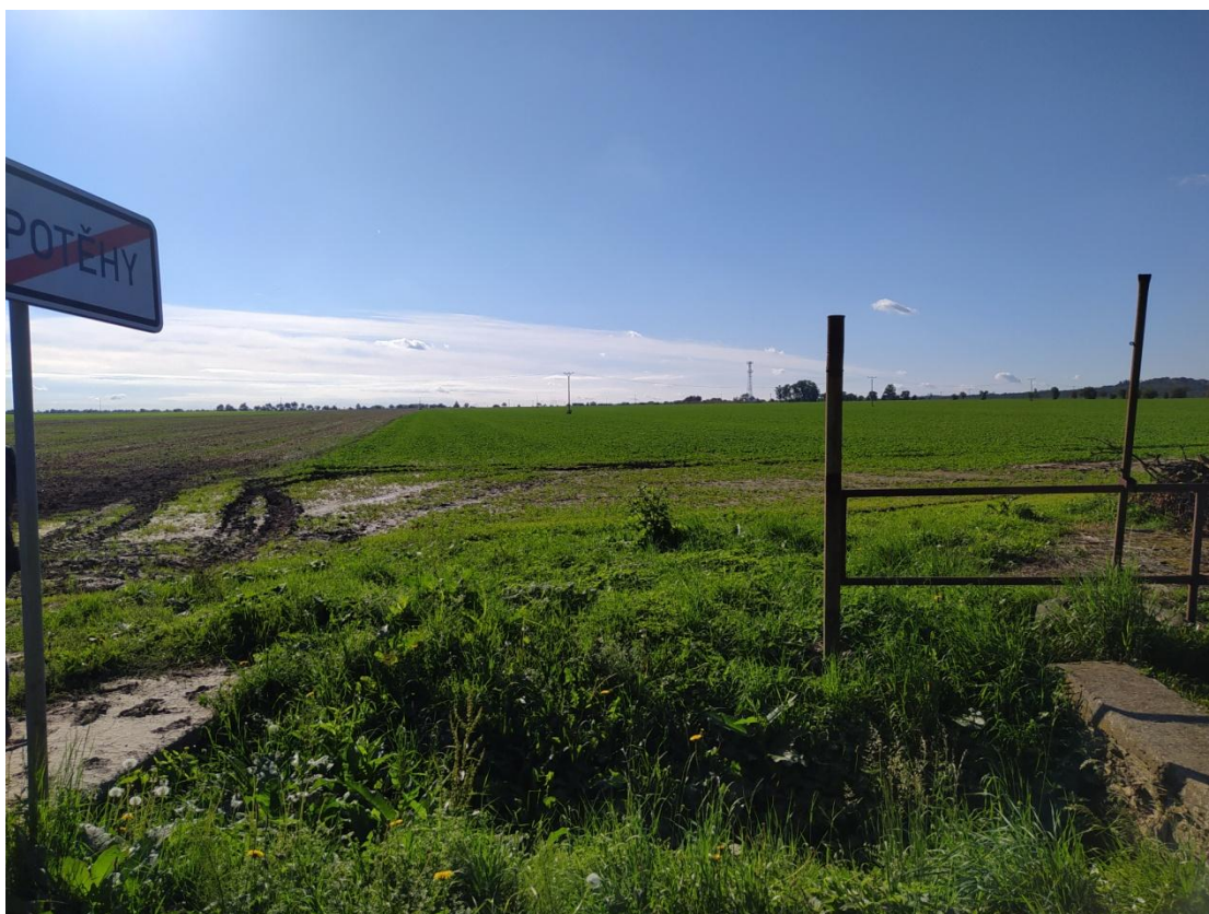
Pohled na začátek úseku při napojení na silnici III/33825 – po staničení